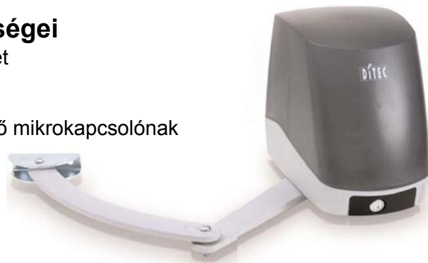
A Facil automatika méretei

Előkészítés a leválasztott lassító egységet jelző mikrokapcsolónak